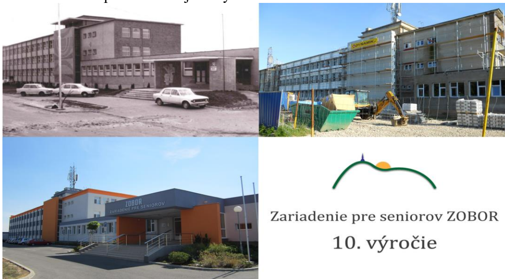
Zariadenie pre seniorov ZOBOR 10. výročie

Rok 2021 je pre naše Zariadenie pre seniorov ZOBOR dôležitým míľnikom, kedy je dôvod na oslavu. Tento rok oslavujeme 10. výročie spustenia prevádzky zrekonštruovaného, moderného zariadenia pre seniorov , ktoré sa vyníma v mestskej časti ZOBOR. Útulné izby zariadenia poskytujú nádherný výhľad na mesto Nitra, aj na Nitriansky hrad. Priestranná a veľkorysá plocha záhrady zariadenia, prináša seniorom mnoho možností na rôzne aktivity ako prechádzky, starostlivosť o kvetinové záhony a prípadne športové aktivity. Dovtedy opustená a zchátralá budova bývalej detskej nemocnice, po rekonštrukcii poskytla nový domov pre seniorov, ktorí sú odkázaní na pomoc druhej osoby.