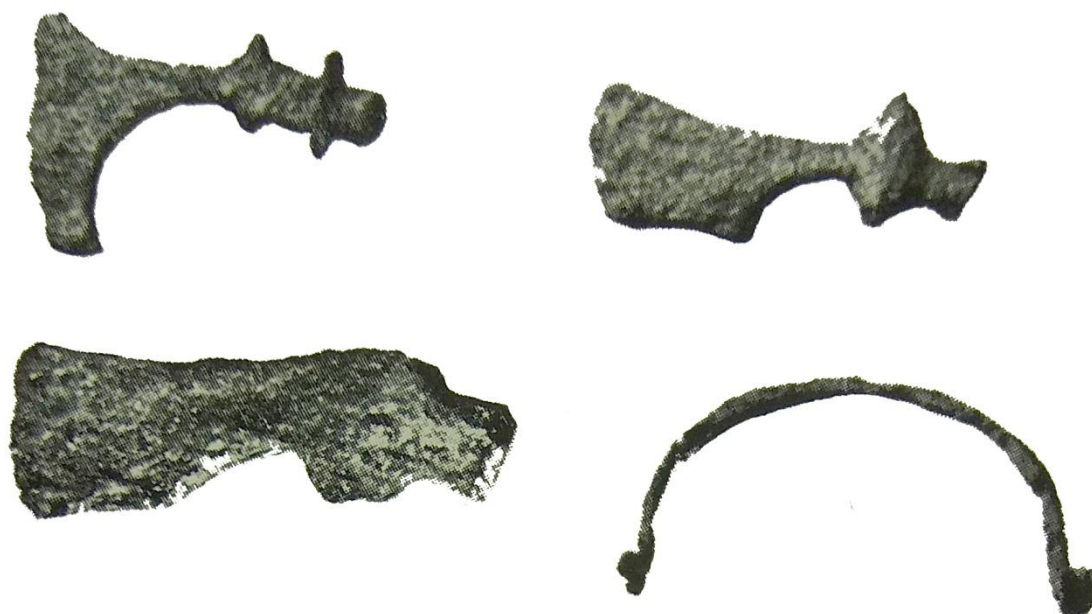
Nálezy z čias osídlenia Slovanmi

Archeologický výskum prebiehal tak, že sa robili rezy valmi, cisternami a preskúmali sa obytné objekty a okolie hradiska. Zistilo sa, že v okolí hradiska v tom čase neboli stromy. Z vojenského hľadiska bolo dôležité, aby stráže mali dobrý výhľad, mohli včas varovať obyvateľov a hlavne uzatvoriť brány. Vyrúbané stromy sa použili ako stavený a podporný materiál a tiež ako kurivo do domčekov. Predpokladá sa, že stromy sa rúbali v čase mieru a to v rámci údržby a prestavby objektov.